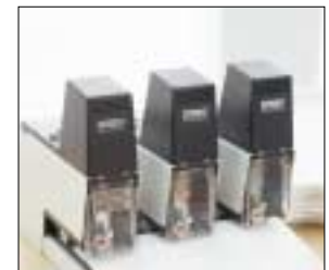
Systematisch erweiterbar: Parallelbetrieb von bis zu 4 Heftern möglich