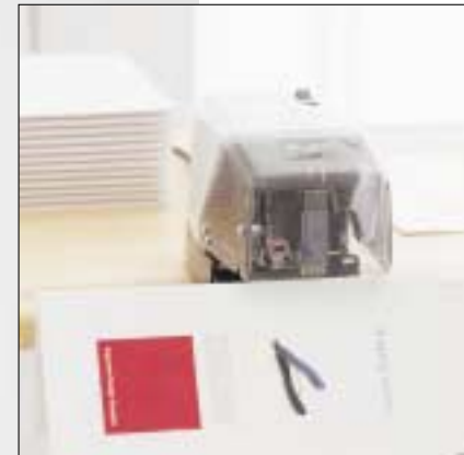
Der Rapid 101 ist optimal für Sattelheftung von Broschüren

100/101 Überall, wo in Sachen Heften Höchstleistung gefragt ist, präsentiert sich der Rapid 100 als optimale Lösung. Dank seiner besonders robusten stabilen Konstruktion ist dieser Elektrohefter wie geschaffen für hohe und dauerhafte Beanspruchung, z.B. in Produktionsbetrieben. Die Features und Details beeindruckend: Das Gerät ist mit Frontladung, stufenlos einstellbarer Schlagstärke, regulierbarer Hefttiefe, wahlweise für offene oder geschlossene Heftung und rutschfesten Saugfüßen ausgestattet. Sein Sicherheits-Plus: beim Abheben der Schutzblende wird die Stromversorgung unterbrochen. Speziell für das Heften von gefalzten Broschüren und Prospekten ist die Modellvariante Rapid 101 geeignet. Dieser Sattelhefter lässt sich am Tisch befestigen und ist mittels Zubehör auch für Ringklammerheftungen geeignet.