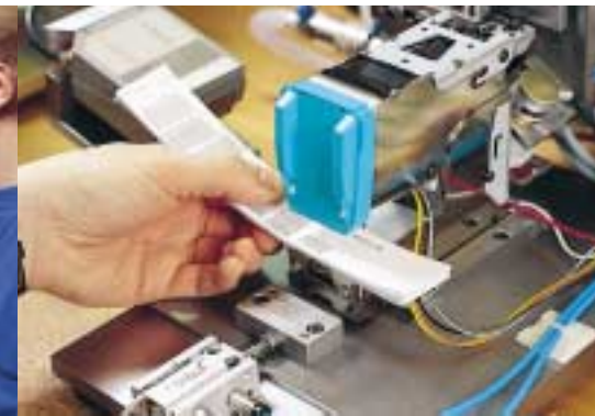
Alle gelieferten Teile werden getestet, bevor sie zu einem Ganzen zusammengesetzt werden