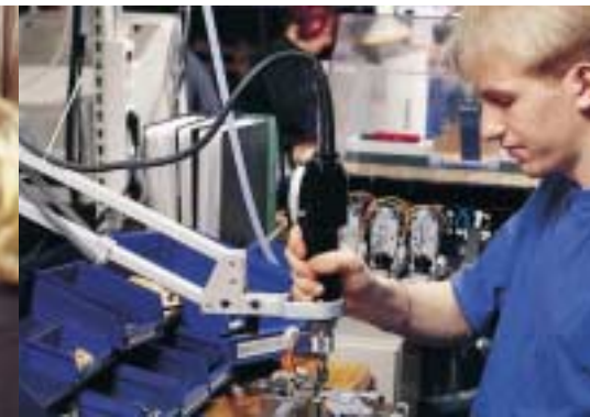
Geliefert wird nur das Rohmaterial. Rapid formt und produziert die einzelnen Teile