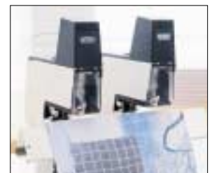
Rapid 106 für Sattelheftung von Broschüren

Die Schlagfertigen: Für vielseitiges Heften in Produktionsbetrieben