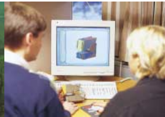
Rapid entwickelt im eigenen Researchcenter neue Hefertechniken

Innovative Qualitätskultur und das Setzen neuer Standards hat im Hause Rapid bereits eine lange Tradition. Das 1936 im schwedischen Hestra gegründete Unternehmen zeichnet sich mit seinen Hefter- und Locher-Produkten vor allem durch seine konzeptionelle Klarheit, minimalistische Raffinesse und Perfektion bis ins Detail aus. Dieses konsequente Engagement hat Rapid in seiner 70jährigen Erfolgsgeschichte zu einem weltweit renommierten Anbieter gemacht – und damit: ein Muss für das moderne Büro.