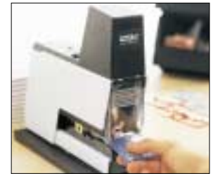
Automatisches Heften mit Pedalauslösung

105/106 Die Elektrohefter Rapid 105/106 zeigen sich als besonders vielseitig einsetzbare „Schwerarbeiter“. So können hier für unterschiedliche Anforderungen bis zu 4 Systeme in Reihe geschaltet werden. Das macht paralleles Arbeiten einfach und effizient. Rapid 105 und 106 sind mehr als robuste Profi-Geräte - sie sind funktionell bis ins Detail: die Hefttiefe und Schlagstärke sind stufenlos einstellbar. Dank Luftdämpfung, 3-Stufen-Technik und federnder Aufhängung sind sie spürbar leiser und damit anwenderfreundlicher im Betrieb als herkömmliche, magnetbetriebene Elektrohefter. Umfangreiches Zubehör macht diese Hochleistungshefter besonders vielseitig einsetzbar. Der Rapid 106 ermöglicht außerdem über einen zusätzlichen Arbeitstisch Sattelheftungen für Broschüren.